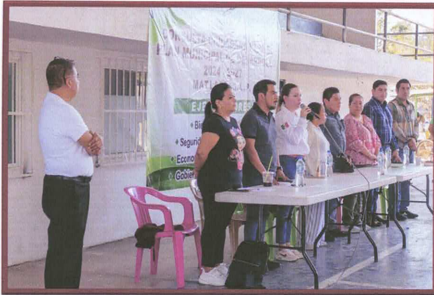
CONSULTA CIUDADANA PARA EL PLAN MUNICIPAL DE DESARROLLO 2024-2027 EN MATLAPA, S.L.P.