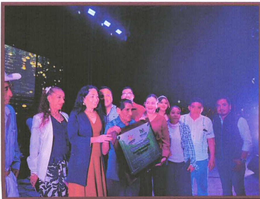
FERIA REGIONAL DE LA NARANJA Y DE LA CESINA (FERENACE 2024)