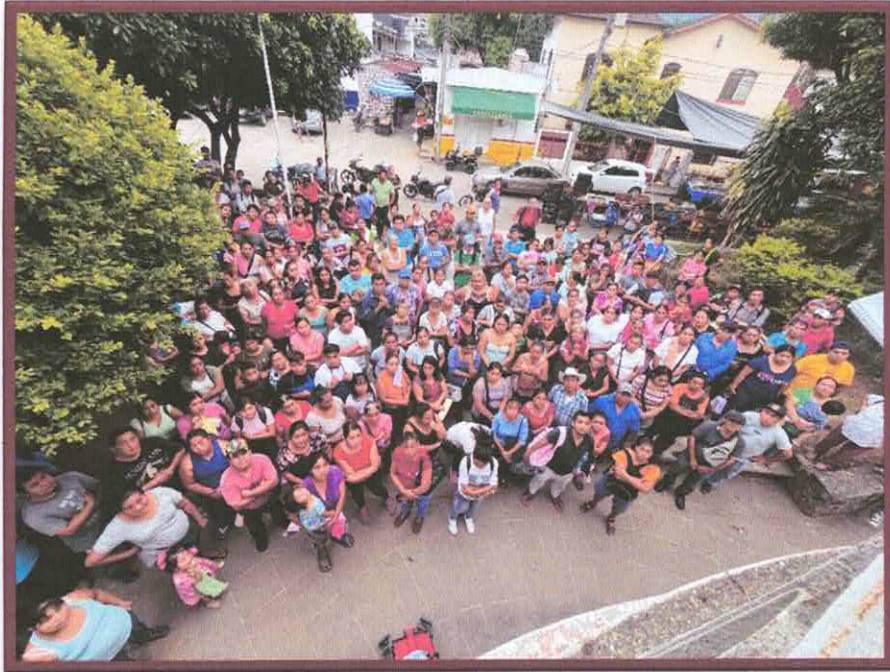
ASAMBLEA CON COMERCIANTES