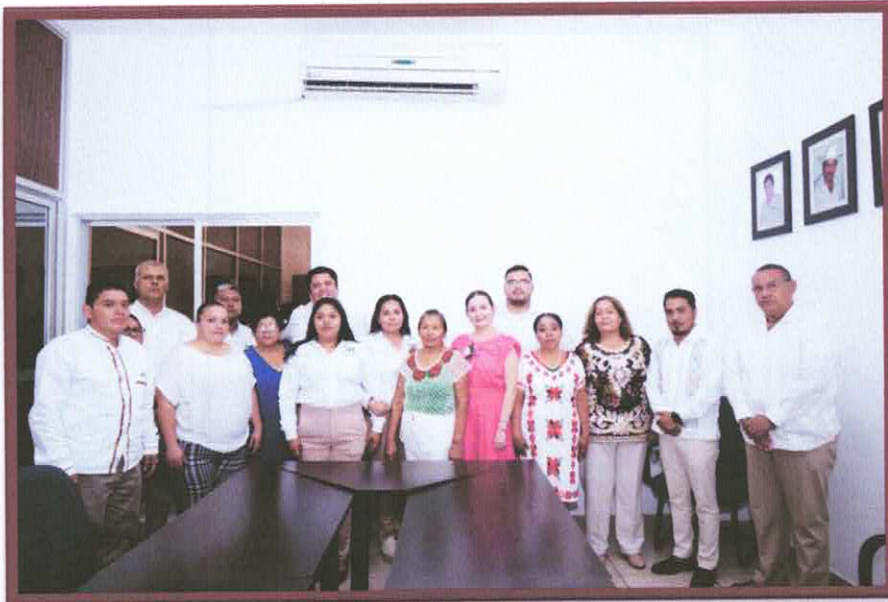
PRIMERA SESION DE CABILDO