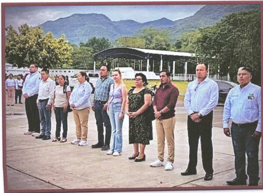
CEREMONIA A NUESTROS SIMBOLOS PATRIOS CADA LUNES