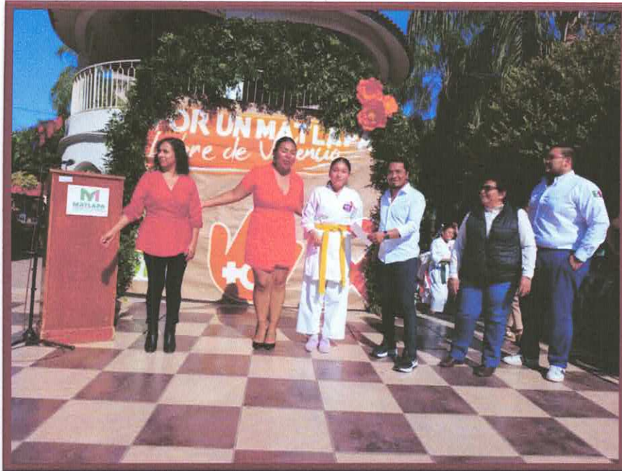
PARTICIPACION EN EVENTOS CON DIFERENTES DEPARTAMENTOS