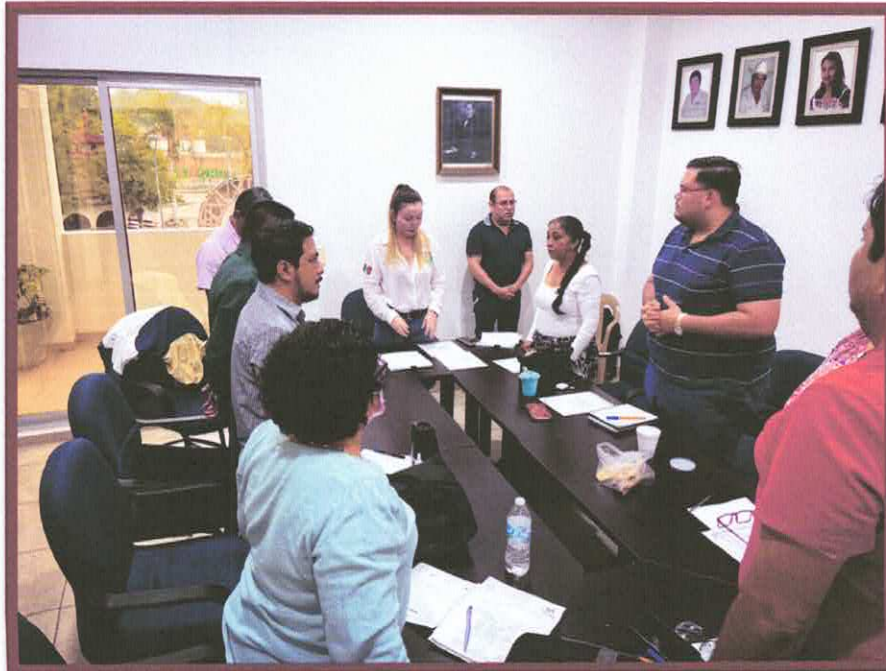
SESIONES DE CABILDO