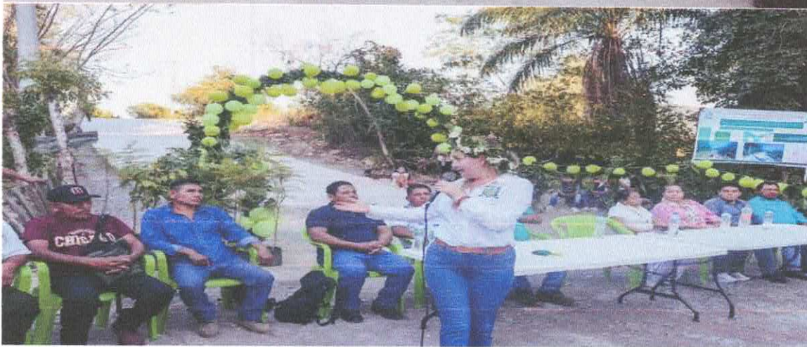
Inauguración de obra hidráulica