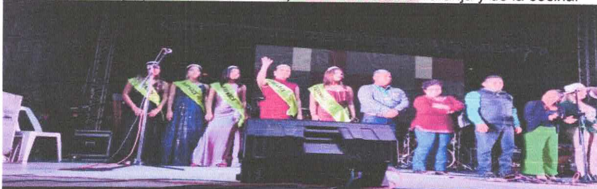
Feria de la naranja y de la cecina.