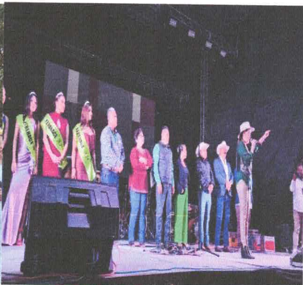
Feria de la naranja (concurso de colotes)