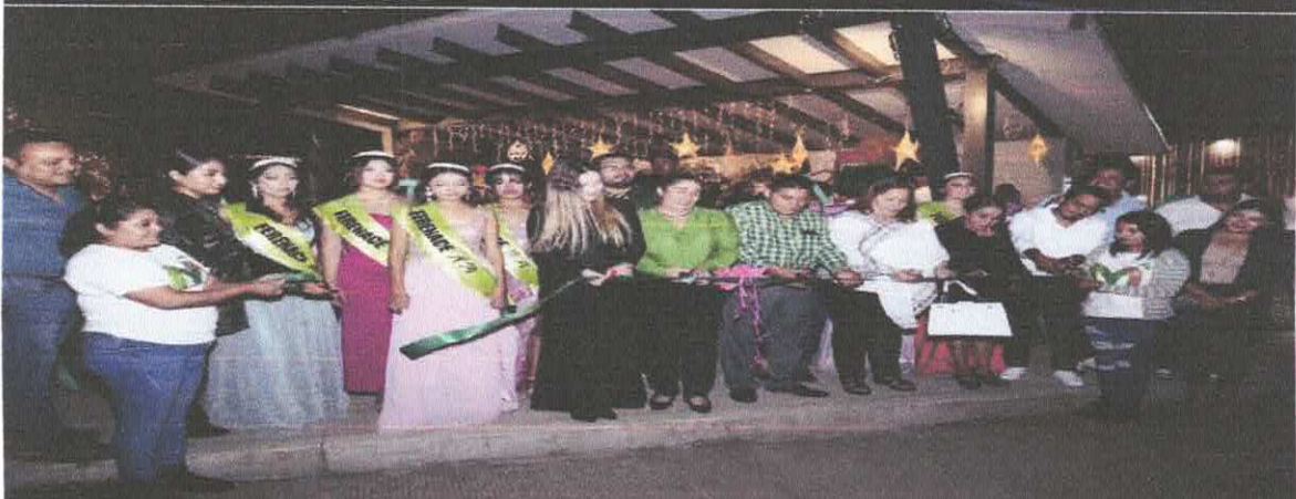
26 de diciembre 2024.- inauguración de la feria